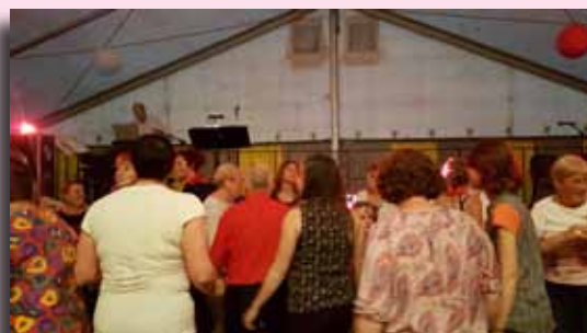
Fête du 1 er juillet des ateliers Egalité des chances