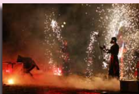
La machine à feu fait son show à Bernissart