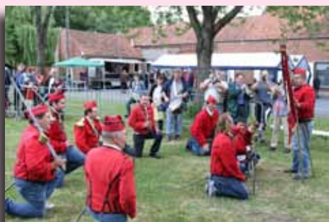
Fête des Hussards à Harchies