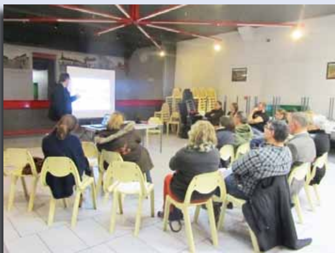
Soirée d'information Harchies

Le premier semestre 2016 a vu de janvier à février la tenue de soirées d'information dans les 5 villages de l'entité. Les citoyens ont pu ainsi cerner les tenants et aboutissants de la démarche mais aussi exprimer leurs préoccupations sur divers sujets de leur quotidien.