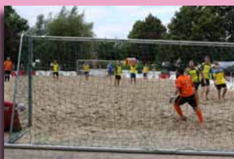
Tournoi de l'ACEB à Blaton