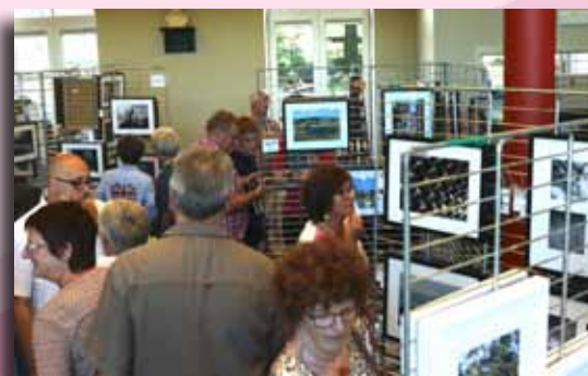
Salon d'ensemble d'Artisamis à Pommeroel