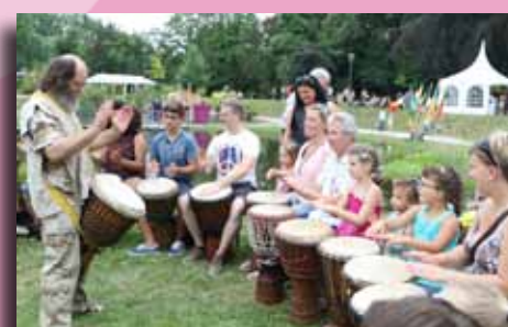
21 juillet au Parc Posteau à Blaton