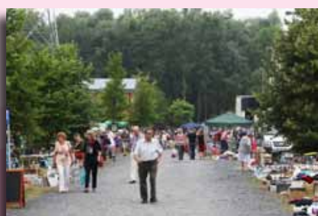
Brocante musée de la mine à Harchies