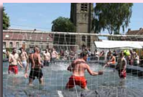
Aqua foot à Pommeroeul