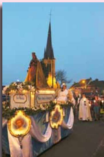
Procession du 15 août à Pommeroeul