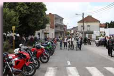
Concentration du MCP à Blaton