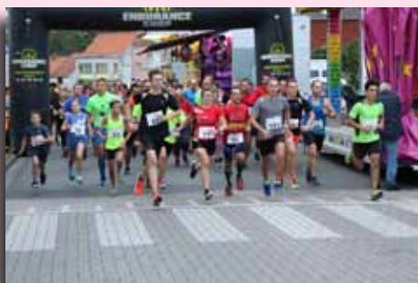
Le jogging de la Ducasse de la Grande Bruyère à Blaton