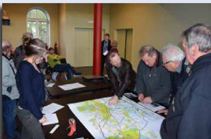
Groupe de travail Mobilité

D'avril à juin, 5 rencontres villageoises se sont penchées, cette fois, sur des sujets précis et avaient pour vocation d'en cerner, pour les villages et l'entité, les points forts et points faibles ; les grandes thématiques (et leurs sous thématiques) suivantes ont été abordées: la mobilité, la vie culturelle et associative, l'économie, l'environnement et les services à la population.