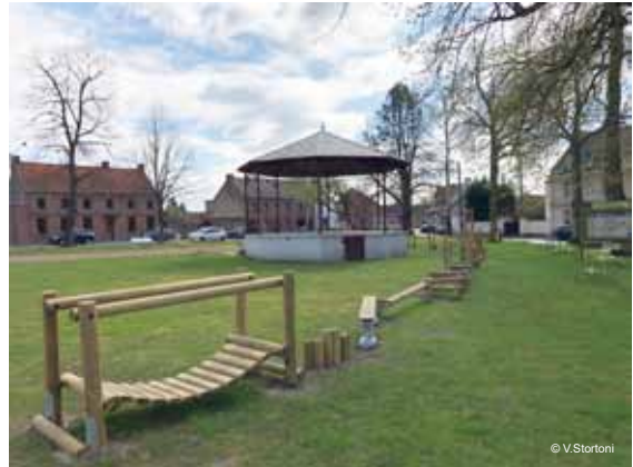
Nouvelle plaine de jeux à Ville-Pommeroeul