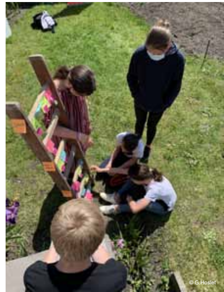
Réunion du conseil des jeunes