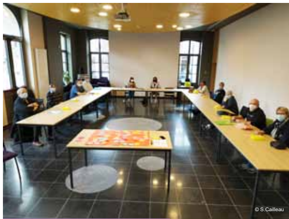
Réunion du conseil des aînés