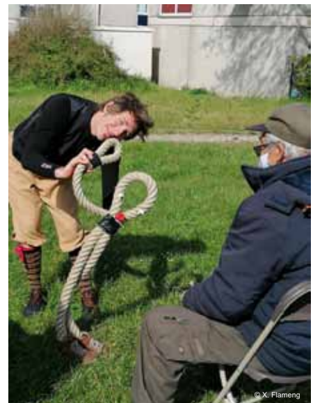
Quartier du Préau (Projet « Plateforme Pauvreté » avec le Réseau Wallon de Lutte contre la Pauvreté)