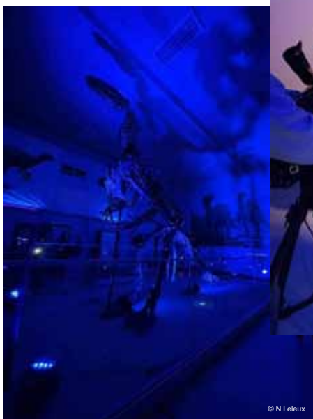
Nuit du musée de l'iguanodon