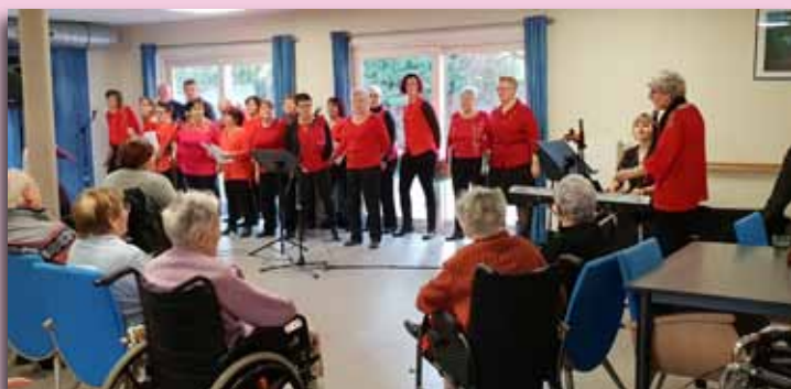
La chorale Berni en chœur au New Beaugency