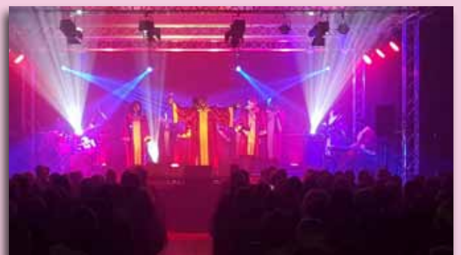
Spectacle Gospel à la Maison rurale de Blaton