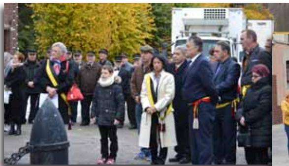
Cérémonies du 11 novembre