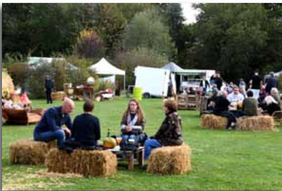
Parc en couleurs